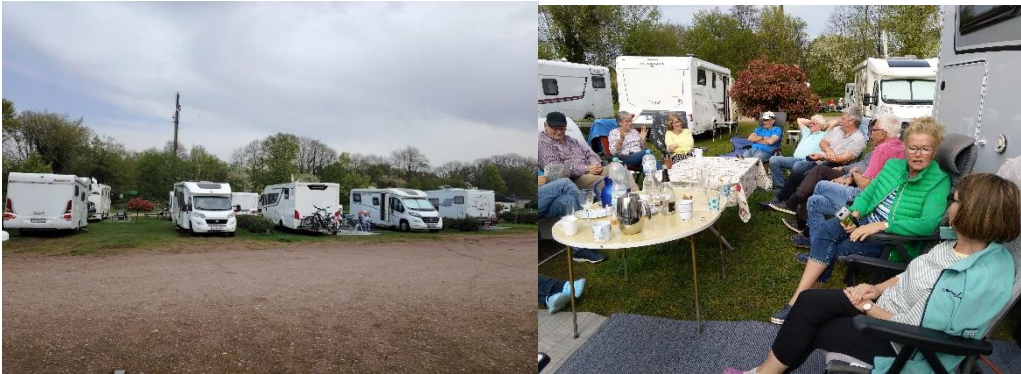
angekommen auf dem Platz

Hier ein paar Eindrücke von der Fahrt durch ein paar Fotos, die aus der Gruppe stammen: