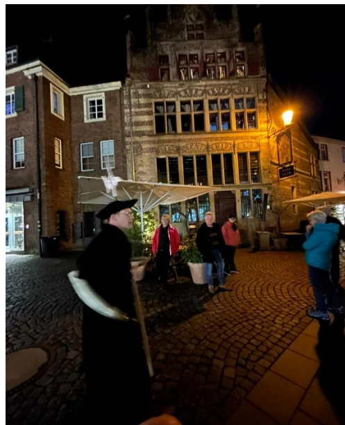
in der Altstadt