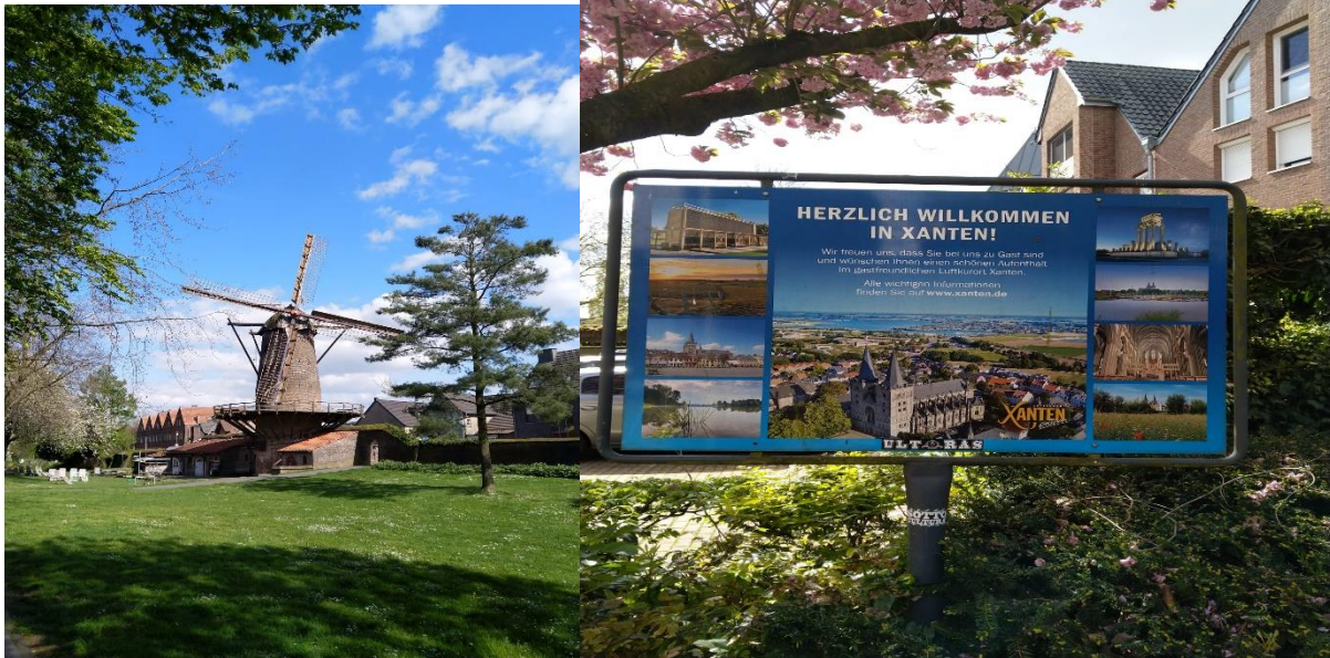
die Kriemhild-Mühle in Xanten